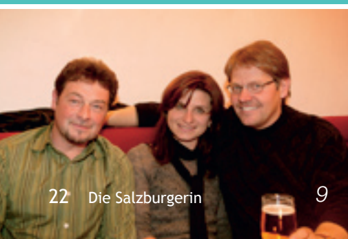
22 Die Salzburgerin